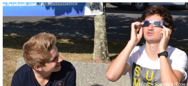
Observation du Soleil - lycée Gaspard Monge La Chauvinière - Nantes

Les lunettes sont accompagnées d'une fiche de sécurité et d'une webographie décrivant les éclipses de Soleil et l'observation du Soleil.