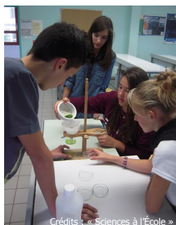
Crédits : « Sciences à l'École » Élèves du collège Falabregue Académie de Lyon)