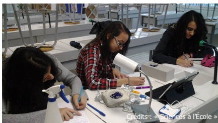
Des élèves du collège Henri Wallon académie de Versailles