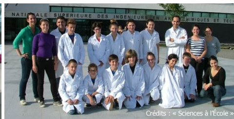
Des élèves du collège Rieupeyroux académie de Toulouse

Le second tour d'inscription au concours C.Génial s'est clôturé fin janvier. Le record d'inscription de l'année précédente a été battu : la compétition compte maintenant 336 projets collège (325 en 2014) et 134 projets lycée (105 en 2014). Le concours compte pour la première fois des établissements de Mayotte et des lycées professionnels . Il touche plus de 1700 lycéens et près de 8000 collégiens !