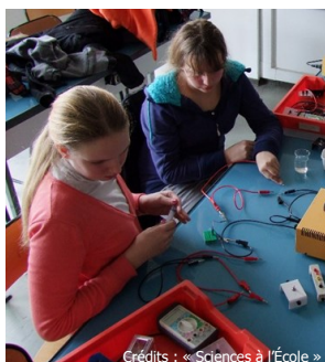
Crédits : « Sciences à l'École » Élèves du collège Porticcio Académie de Corse