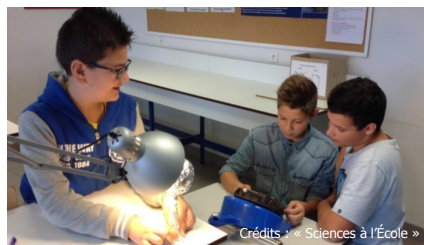
Des élèves du collège Saint André de Cubzac académie de Bordeaux