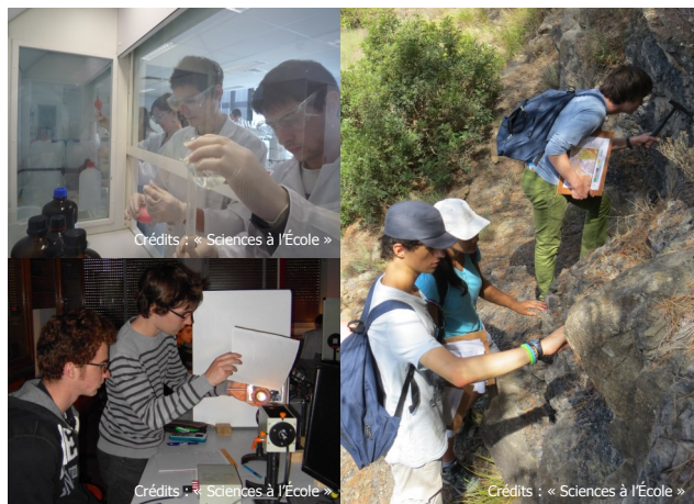
Préparations françaises des olympiades internationales de chimie (en haut à gauche), de physique (en bas à gauche) et de géosciences (à droite)

Dans plus d'une centaine d'établissements scolaires, les élèves se préparent activement aux épreuves de sélection pour les Olympiades Internationales de Chimie (IChO), de Géosciences (IESO) et de Physique (IPhOs) qui auront lieu entre le 23 et le 27 mars 2015.